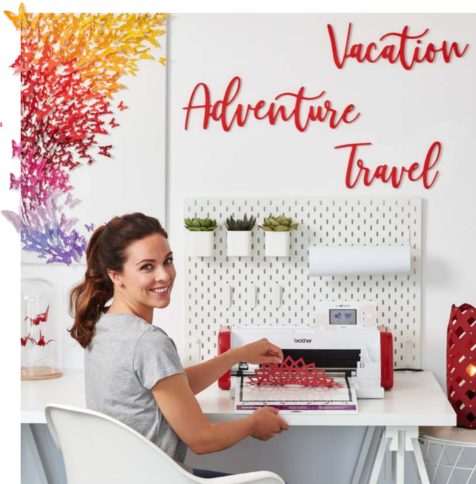
Vacation = Vacances / Adventure = Aventure / Travel = Voyage

Dédiez votre temps à la création ! La SDX900 lit les fichiers SVG - sans conversion préalable.