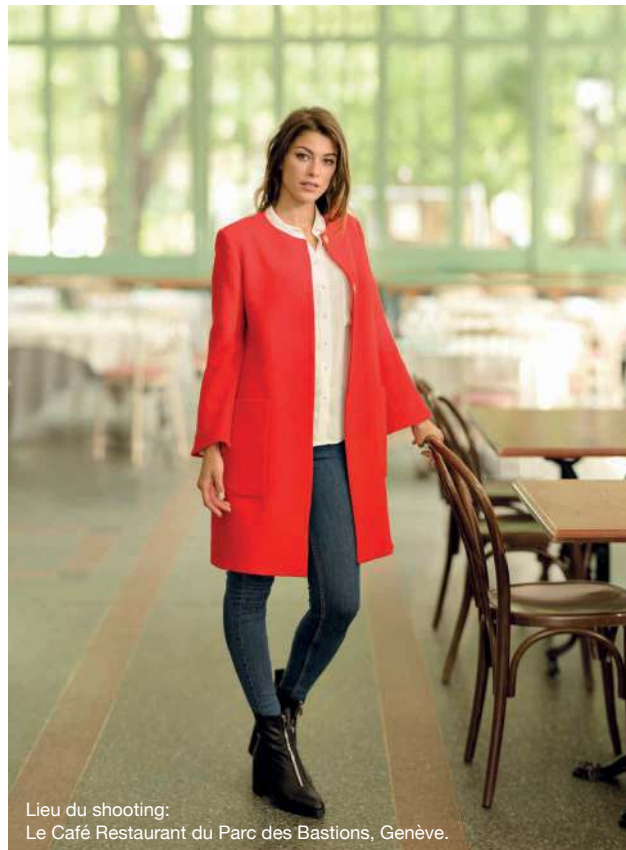
Lieu du shooting: Le Café Restaurant du Parc des Bastions, Genève.

Peu importe que vous recherchiez l'aspect décoratif ou fonctionnel, vous saurez apprécier la précision et la qualité régulière de tous ces points. La fonction mémoire du modèle 570α vous permet de créer des combinaisons de points personnelles et uniques ou de programmer du texte et des noms.