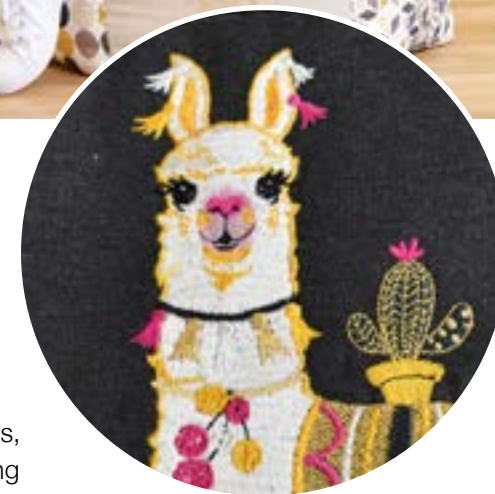
Divers motifs amusants, de quilting et de bordure